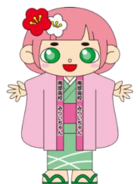
南部高校マスコットキャラクター みらいちゃん