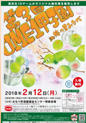
UME - 1グルメ甲子園のポスター