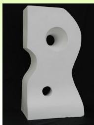
調子ちえ 「Rなカタチ」