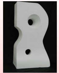
調子ちえ 第4席 読売賞 「Rなカタチ」

2人の作品は、7月20日（水）～24日（日）まで、和歌山市民文化会館で展示されます。