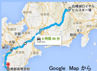
Google Map から

スキー・スノーボードだけでなく、クラスを越えた友人との親交が深められたり、集団の中での個人のあり方を見つめられたりと、様々な面で有意義な修学旅行になったのではないのでしょうか。