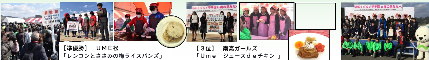
【準優勝】 UME松 「レンコンとささみの梅ライスパンズ」