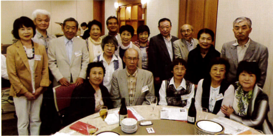
▲17期生の皆さんの記念写真