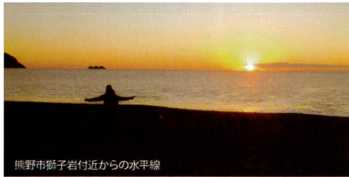
熊野市獅子岩付近からの水平線

日本最古の神社といわれる花の窟(いわお)神社を過ぎると熊野川までひたすら単調な海岸線の道、元日のお昼過ぎに速玉大社到着。5日間の歩数は、約20