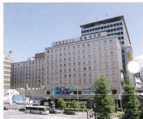
■総会会場は梅田の新阪急ホテル