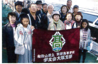
▲秋の親睦会での記念撮影風景