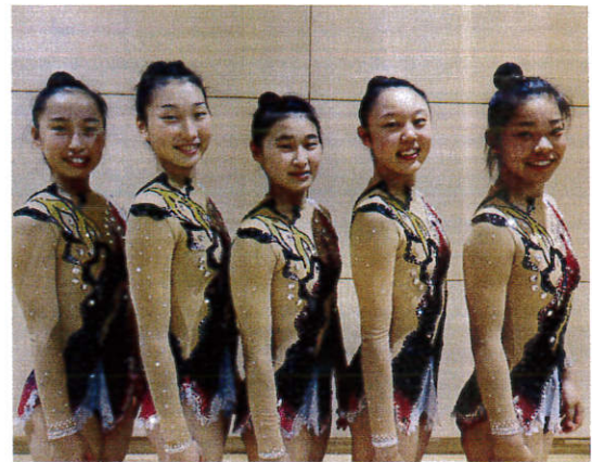
▲南部高校・新体操部のみなさん