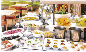
▲ホテル京阪のランチ