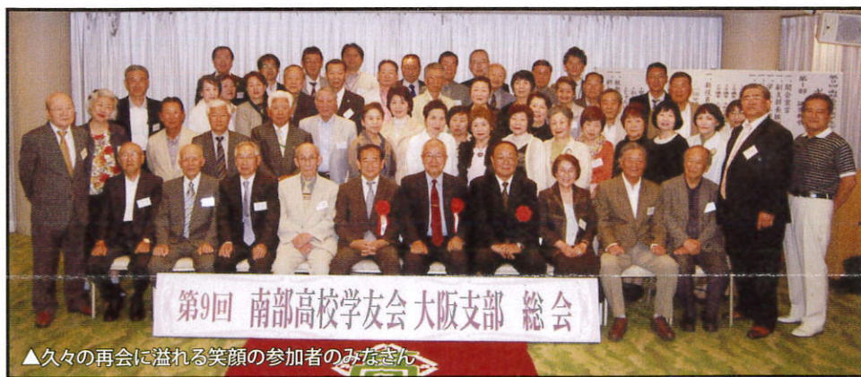
▲久々の再会に溢れる笑顔の参加者のみなさん

第10回支部総会開催のご案内 南部高等学校学友会大阪支部は、卒業生の皆さまのご支援とご協力により、節目となります「第10回支部総会」を迎えることになりました。5月22日(日)に梅田の新阪急ホテルにて開催の運びとなりましたので、是非多くの皆さまのご出席をただけますようお願い申し上げます。総会では同期のミニクラス会や同窓会も盛んで、この機会に是非あなたのご出席お待ちしております。