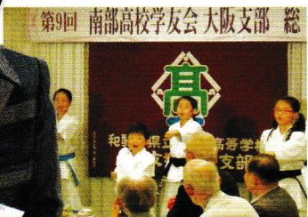
▲子どもたちの空手模範演技風景