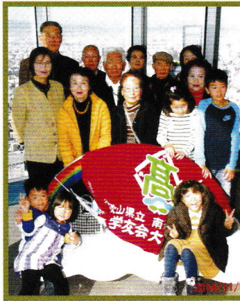
参加者多数のために、記念写真は3枚になりました。

去年は2月に梅林ツアーがあり、そして5月には総会があり、秋には親睦会として「あべのハルカス」とランチを楽しむ催事があり、何かと多忙な一年でした。この日は子どもではなくお孫さんやご家族と一緒に学友会仲間の方が多く、日本一高い商業施設ビルの醍醐味を十分味わい、本当に賑やかな親睦会となりました。実行委員をはじめお世話いただきました委員の皆さんには、ハルカスの入場券の確保や、食事の手配など本当にお手間をかけたと思いますが、こんなに大勢の方々にご参加いただけたことで、日頃のコミュニケーションの大切さを改めて感じることができました。本当にありがとうございました。