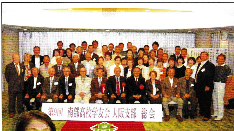
▲久々の再会に溢れる笑顔の参加者のみなさん

第九回支部総会は平成26年5月18日、大阪市内の道頓堀ホテルにて開催されました。 学友会は2年毎に開催されますが、最近支部外にお住まいの卒業生も出席されるなど、年代別のミニクラス会のような傾向も多くなってきました。 そう言った意味では、普段なかなか機会を持ってなくともあり、支部総会を利用して久々の再会を喜び合うことは、本立に有意義なことではないでしょうか。 久々に口ずさむ母校の校歌斉唱に、思わず力を込めながら、名残つきな思い出の一日となりました。 次回総会は平成28年の開催となります。