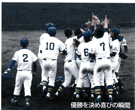
優勝を決め喜びの瞬間