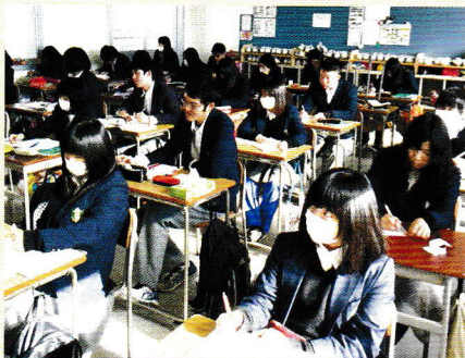
▲今も昔と変わらない授業風景と生徒たちの純朴さですが、時代と共に生徒たちの気質や思考は変化しているようです。

います」と授業に行っていない全然知らない生徒からも挨拶が交わされるようになってきています。