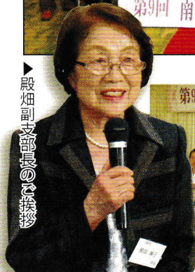
▲殿畑副支部長の挨拶