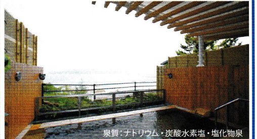
泉質: ナトリウム・炭酸水素塩・塩化物泉