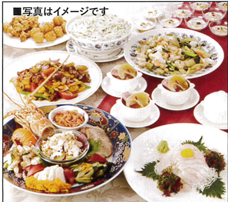
■写真はイメージです

学友会支部総会は2年毎の開催で今回が9回目となります。 この2回の総会は団塊の世代に代表される卒業生の皆さんが、65歳という年齢に達したこともあり、時間的に余裕を持つことで、徐々にご出席いただく人数も増えていきますので、今回も是非ご参加いただけますようご計画ください。 ご出席は関西在住の方に限らず、田舎や関西以外で暮らすお友達に声を掛けられ、久々のミニ同窓会(おしゃべり会)を楽しまれる...という方も多くいらっしゃいます。お席はご希望にそって同期生だけのスペシャル席もご用意いたします。