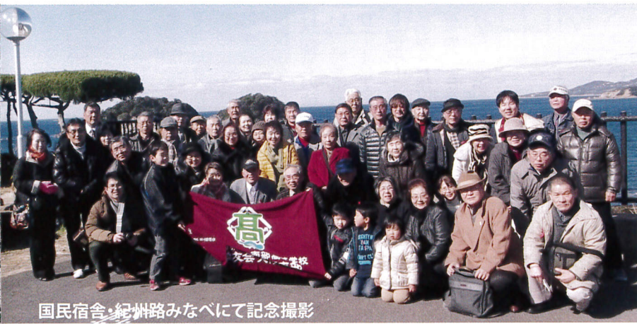
国民宿舎・紀州路みなべにて記念撮影

同じ職場の友人を誘ったところ、「行こう」ということになり、今回初めて参加することになりました。国民宿舎の温泉に入り、身も心もリフレッシュ・リラックスできました。 バスから降りると、「梅咲く丘の香りから...♪」(上南都小の校歌より)が自然と口から出てきたことに自分でも驚きながら、25年ぶりに花見の時期での帰郷となりました。そう言えば25年前、出産予定日を10日過ぎていた嫁に近所のおばちゃんより「梅坂を登っておいで」とのアドバイスをいただき、2人で登りました。なんとそのあと、陣