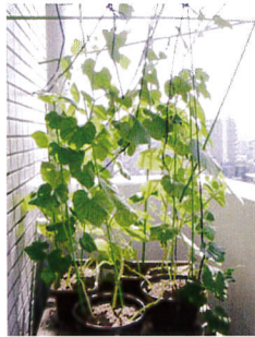
◆写真上/川上さんが育てているヒョウタン ◆写真下/育ったヒョウタンで作った作品 ◆写真右/ベランダでも作れますよ!