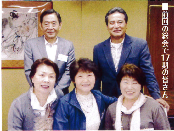
■前回の総会で17期の皆さん

懐かしい笑顔が待っています。 2年毎に開催される南高学友会大阪支部総会が(第9回)5月18日(日)に開催されます。今年の総会も前回同様楽しい集まりになるよう、様々な企画をご用意して皆さまのご出席をお待ちしています。「同期のお仲間やお友達をお誘いいただき、思い出多い支部総会となりますようご案内申し上げます。