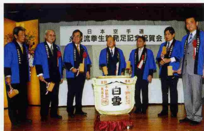
▲記念式典にて鏡割り風景/大野支部長(写真左)をはじめ、箕面市長等のみなさんと式典開始。