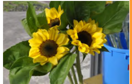
切り花のヒマワリ ユリは来月