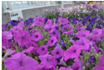
様々な色のペチュニア